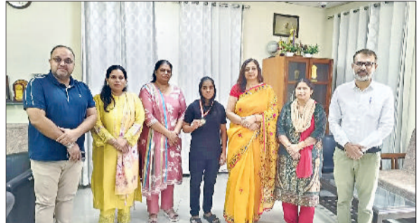
खरखोदा। छात्रा का स्वागत करते प्राचार्या व अन्य।