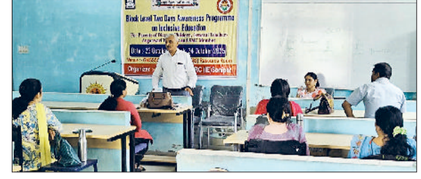
सोनीपत। कार्यक्रम के दौरान जानकारी देते अतिथिगण।