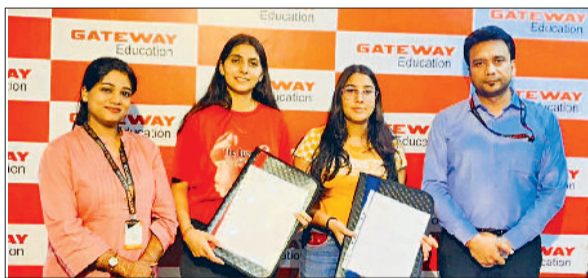
सोनीपत। छात्रों के साथ कंपनी के अधिकारी एवं अन्य।

रोहताक। पंजाब नेशनल बैंक द्वारा 24 अक्टूबर को पैन इंडिया में कृषि आउटरीच कार्यक्रम का आयोजन किया जा रहा है। मुख्य उद्देश्य कृषि ऋण के बारे में ज्यादा से ज्यादा जानकारी उपलब्ध करवाना एवं इसकी स्वीकृति में लगने वाले समय को कम कर मौके पर ही स्वीकृति देना है। उन्होंने कहा कि युवकों से अपील की है कि वे कार्यक्रम में ज्यादा से ज्यादा संख्या में पहुंचें।