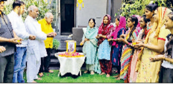
चेन्नम्मा भारत के कर्नाटक के कित्तूर राज्य की रानी थीं। वह ब्रिटिश ईस्ट इंडिया कंपनी के खिलाफ लड़ने वाली पहले भारतीय शासकों में से एक थीं। रानी चेन्नम्मा ने 1824 में ब्रिटिश शासन का सख्त विरोध किया। उनके साहस ने उन्हें कर्नाटक तथा पूरे भारत में एक नायिका बना दिया और वह आज भी लोगों के लिए प्रेरणा का स्रोत हैं।