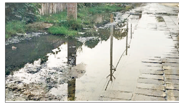
गन्नौर। नाले अवरुद्ध होने से सड़क पर फैला दूषित पानी।

नाले बंद होने के कारण सड़कों पर जमा हो रहा दूषित पानी हरिभूमि न्यूज ▶▶ गन्नौर गांधी नगर के हालात इन दिनों बेहद दयनीय बने हुए हैं। ओवरब्रिज के सर्विस रोड पर सीवर ओवरफ्लो से लोगों का आना-जाना मुश्किल हो गया है। सड़क पर दिनभर गंदा पानी फैला रहता है, जिससे राहगीरों और वाहन चालकों को भारी परेशानी का सामना करना पड़ रहा है। स्थानीय लोगों का कहना है कि कई बार शिकायत करने के बावजूद विभागीय अधिकारी स्थिति सुधारे