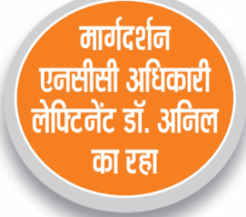
हरिभूमि न्यूज ▶ गोहाणा

कैडेट्स ने ड्रिल, फायरिंग व विज्य सहित अन्य गतिविधियों में फहराया परचम