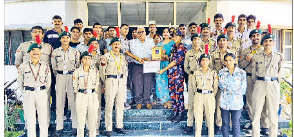
गोहाणा। गुरुजनों के साथ पदक विजेता एनसीसी कैडेड्स।

महाविद्यालय के एनसीसी कैडेड्स ने एटीसी-129 कैम्प में ड्रिल, फायरिंग, विज्य, गार्ड ऑफ ऑनर, सांस्कृतिक एवं खेल गतिविधियों में अपनी प्रतिभा का परचम फहराया। कैडेड्स की ड्रिल टीम ने विशेष रूप से कैम्प में अनुशासन, तालमेल और जोश का शानदार प्रदर्शन करते हुए प्रथम